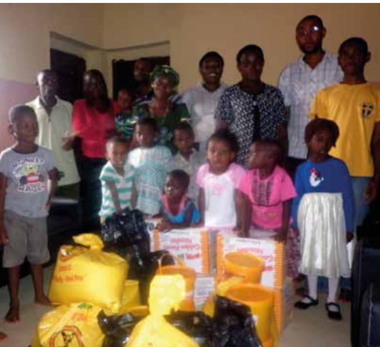
Gruppentreffen mit Eltern

Mit der zusätzlichen Unterstützung können wir die Lebensqualität der Familien erheblich steigern.